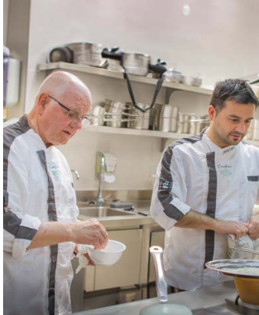
JAIME SANZ E HIJOS

Av. del Papa Luna, 5 · 12598 Peñíscola (Castellón) · 964 480030 casajaimel967@gmail.com · www.xn-casajaimepeiscola-pxb.com/